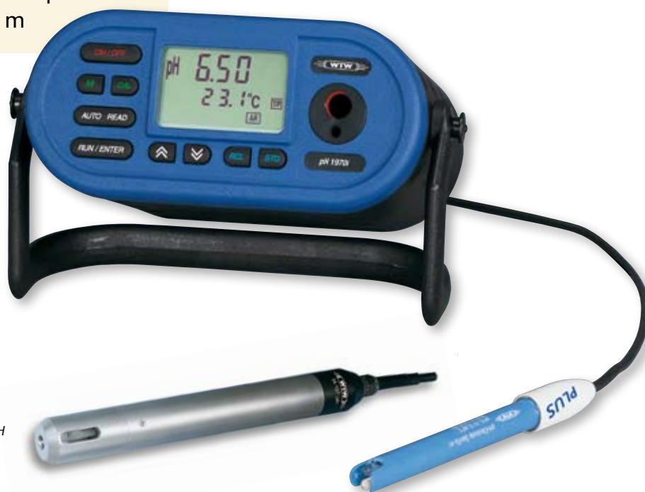
Tiefenarmatur TA 197 pH

Das pH 1970i mit eingebautem leistungsfähigem NiMH-Akku besitzt einen integrierten Vorverstärker und eignet sich deshalb in Kombination mit der TA 197 pH Tiefenarmatur für Tiefenmessungen bis 100 m.